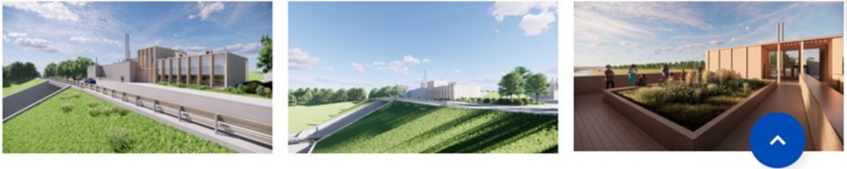
^Document E : Capture d'écran du site du CSNE , consulté le 21 février 2024.

Cette écluse fait également partie des 3 écluses qui seront visitables par le public avec un bâtiment d'accueil et une terrasse belvédère.