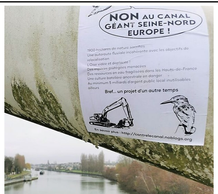
Document G : photographie d'A.BISSON extraite d'un article de Le Parisien , 23 avril 2023, consulté le 22 mai 2024.

Virginie KUBAKTO, « À Noyon, le projet du port intérieur avance », La Gazette Oise , 28 mars 2022, consulté le 19 mars 2024.