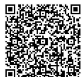
Illustration : Anatole Blondiaux

PARTICIPEZ À L'AVENTURE SUPER ESPÈCES ET DEVENEZ AUTEUR·RICE DE BANDE DESSINÉE