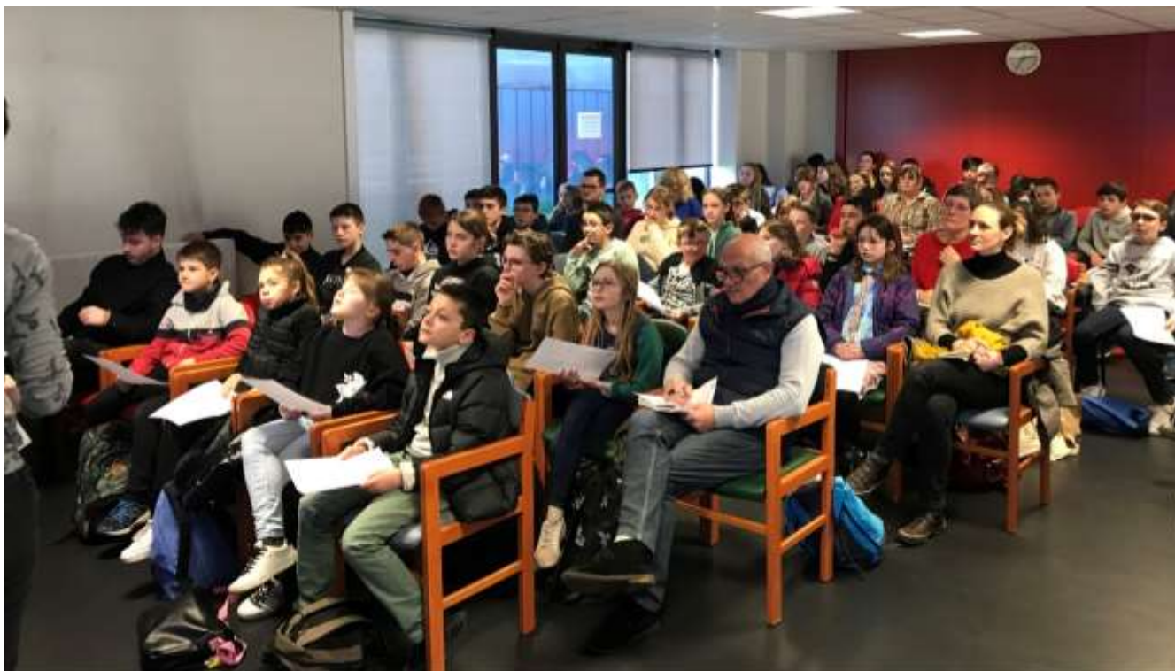
Quelques élèves ont aussi participé à l'animation plus directement...