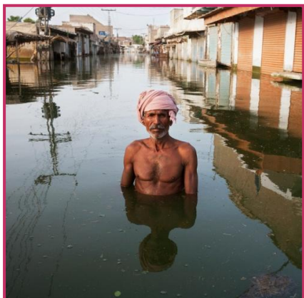
Submerged Portraits, 2010

- Regarder des photographies de l'exposition de Gideon Mendel "Submerged Portraits and Archaeology from a Climate Emergency", qui s'est déroulée à la Maison de la Culture d'Amiens du 04/10 au 11/11/19.